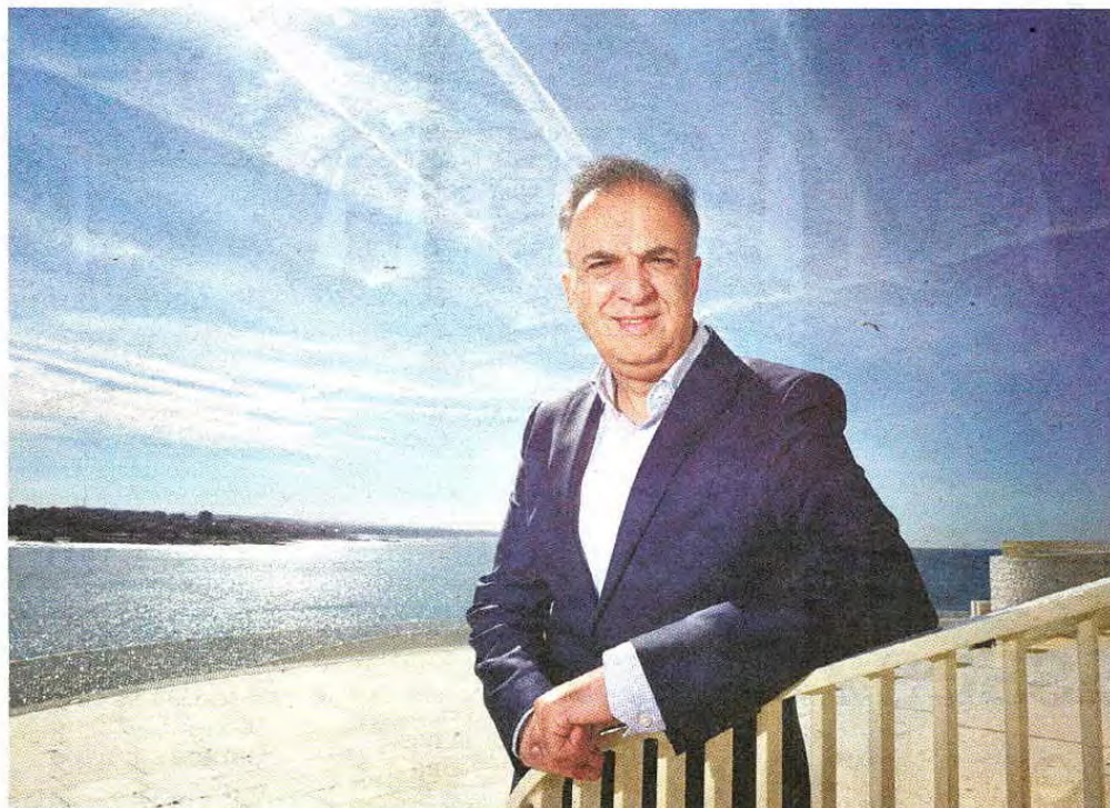
PEDRO GRANDERINO / GLOBAL IMAGES

O ano começou bem para o Porto e o Norte: quase meio milhão de dormidas, em janeiro, num crescimento de 10,5% que é o dobro da média nacional. Os proveitos também continuaram a crescer em ritmo acelerado (mais 11,4%, para 26,4 milhões de euros), o que significa que a região ganhou mais com cada turista. “O Porto e Norte não é uma moda, nem há turistas a