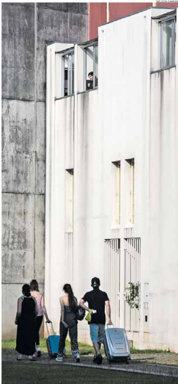
Brigadas foram criadas em 2014, quando só existam 16 mil AL

Em Fevereiro de 2018, o sindicalista foi a uma comissão parlamentar na Assembleia da República e fez um retrato do sufoco em que vive a ASAE, não apenas no que à fiscalização dos AL diz respeito. No total, havia (os