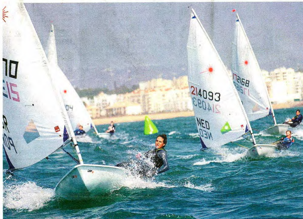
Os velejadores olímpicos dos países frios passam meses a treinar nas águas ao largo de Vilamoura

O projeto Vilamoura Sailing arrancou em setembro de 2017 e já reúne mais de 400 atletas num período de seis meses. Entre os que fugiram ao inverno há campeões e medalhados olímpicos