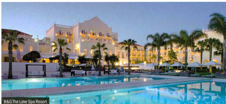
B&amp;G The Lake Spa Resort

sabe mesmo bem. A massagem especial para golfistas, os retiros detox, o alinhamento dos chakras e a terapia de flexibilidade estão disponíveis ao longo do ano e fazem parte do compromisso do grupo com a promoção de uma vida activa e saudável. Os três restaurantes do hotel colecionam experiências gastronómicas e não falham na oferta de sugestões equilibradas para ajudar na missão – sobretudo o Ria, com carta só de peixe e marisco da