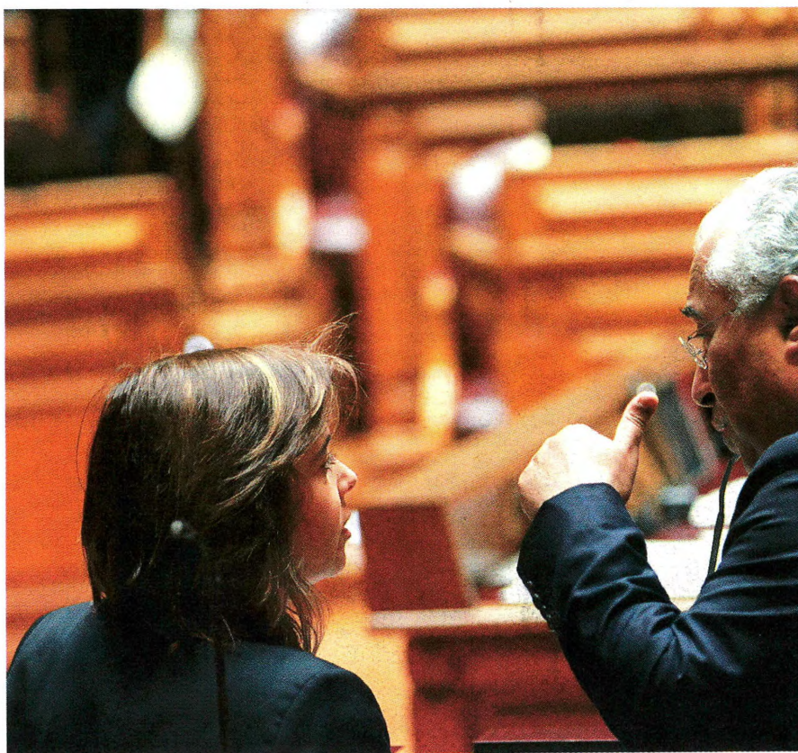
A gerigonça vive dias conturbados. Depois dos professores e da Saúde as divergências surgem agora na Habitação.

E são vários os aspetos em que o texto socialista se afasta das iniciativas da esquerda. “Há um pro-