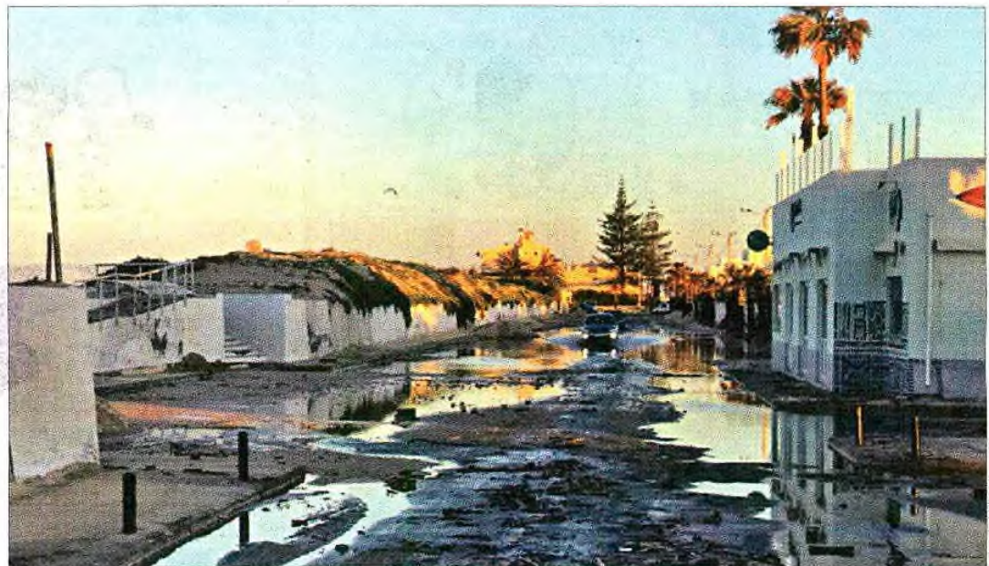
Na praia de Faro os galgamentos de água poderão alcançar toda a península, afetando todas as habitações

A solução proposta passa pela alimentação artificial da praia, numa primeira fase, e depois, a partir 2040, deverá ser necessário “retirar e relocalizar a pri-