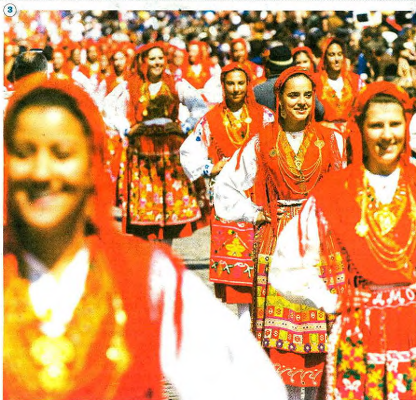
1 Festa em honra da Senhora da Assunção, na Póvoa de Varzim