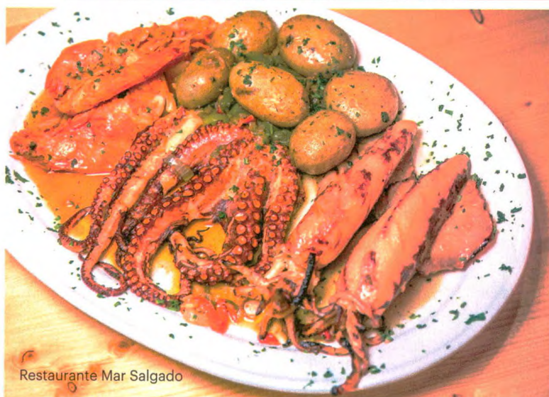
Restaurante Mar Salgado