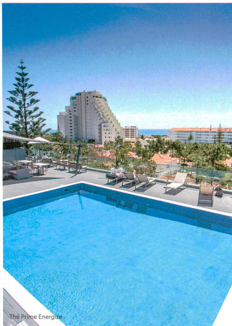
The Prime Energize