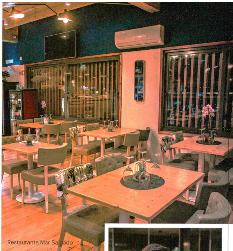
Restaurante Mar Salgado

conquilha, amêijoas e sapateira acompanhados de batata a murro – e o polvo à Mar Salgado são dois dos pratos que merecem referência, numa carta que foge inteligentemente ao peixe grelhado tradicional. O empratamento mais cuidado também marca pontos, em linha com a oferta de vinhos do Algarve e de outras regiões.