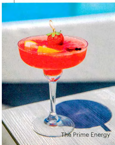
The Prime Energy

Voos a 300 metros de altitude sobre as salinas e os sapais de Castro Marim, a olhar o rosa dos flamingos.