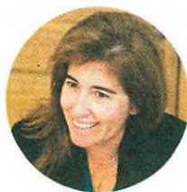
ANA MENDES GODINHO Secretária de Estado do Turismo

o país, faz com que seja permanentemente necessário qualificar e atualizar os recursos humanos que já estão no mercado de trabalho.