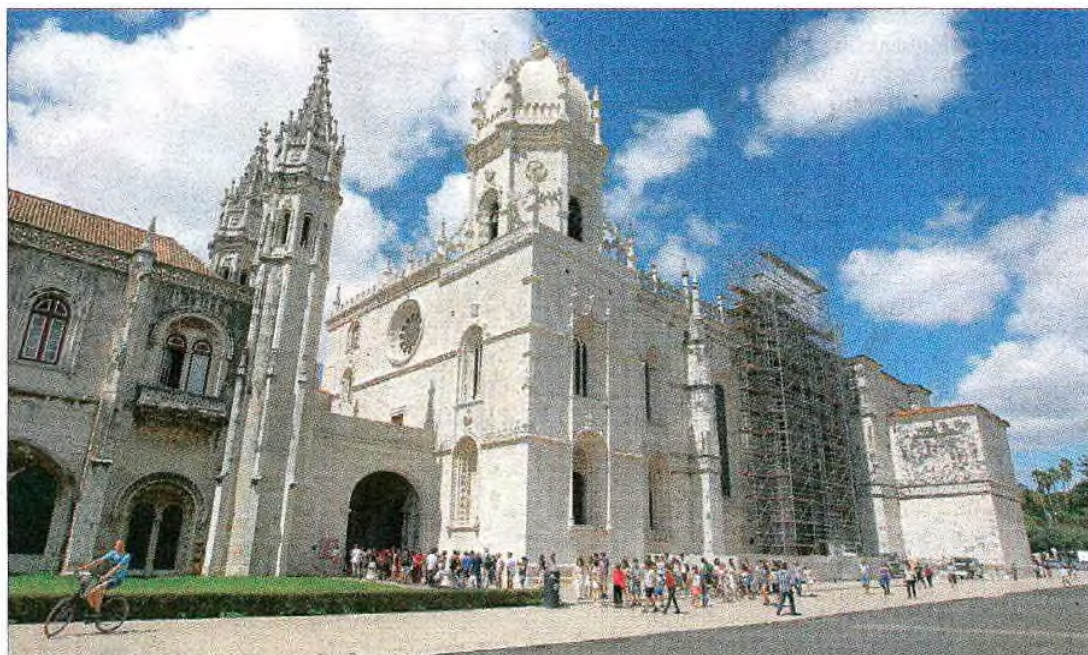
O Mosteiro dos Jerónimos e a Torre de Belém têm 1,6 milhões de visitantes por ano e foram os mais visitados em 2018

O Mosteiro dos Jerónimos e a Torre de Belém registam 1,6 milhões de visitantes por ano,