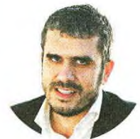
Carlos Guimarães Pinto Presidente Iniciativa Liberal

"Temos de ter menos Estado onde este é um obstáculo à economia" ● P6